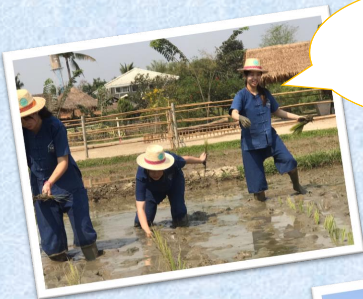
ジンジャーファームで 苗植え体験 Planting experience at Ginger Farm

I recommend this program not only to those who are interested in Thailand or who want to study/are studying Thai, but I also to those who want to discover a new side of yourself. You can learn about Thailand through learning their food culture, religion and from many other aspects. You can also communicate with local people, so you can satisfy both, learning and experience of Thailand. Prices in Thailand are cheaper than Japan, so it is easier to try things. I hope you guys participate in this program and have a rewarding experience.