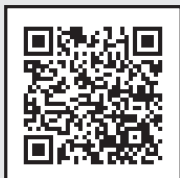
大分銀行宗麟館へのアクセス

QRコード読みとり機能のある携帯電話をお持ちの方は、こちらからお申込み可能です。